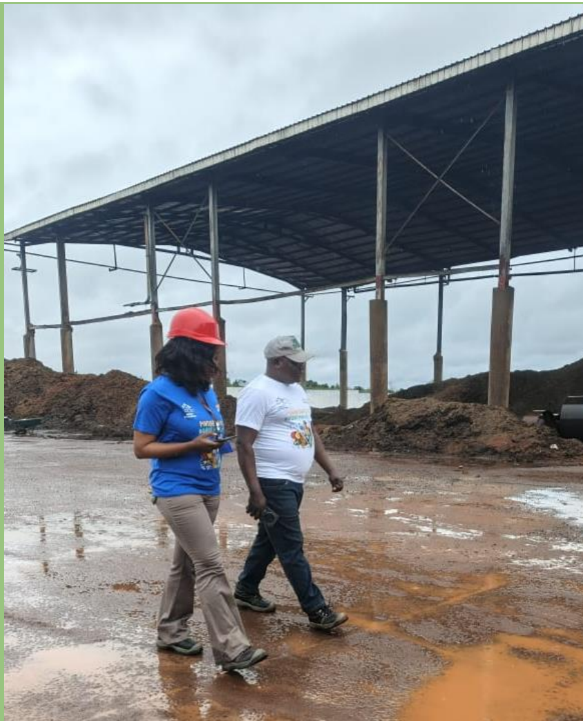
Défi 10 000 à SOSUCAM

183 504 Pas parcourus Défi 10 000 pas 19 collaborateurs