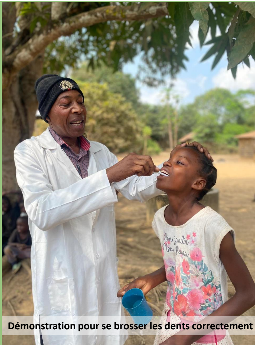
Démonstration pour se brosser les dents correctement

1,1M Pas parcourus Défi 10 000 pas 120 collaborateurs