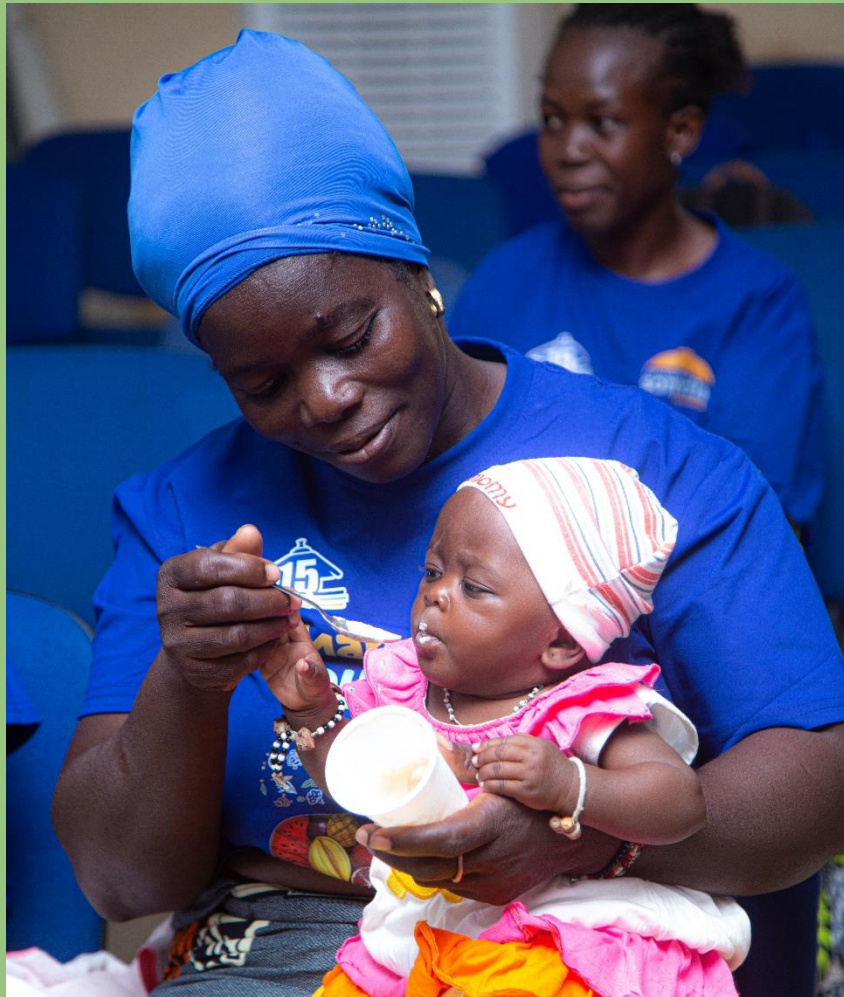
Dégustation de la bouillie infantile préparée lors de l'atelier

724 350 Pas parcourus Défi 10 000 pas 75 collaborateurs