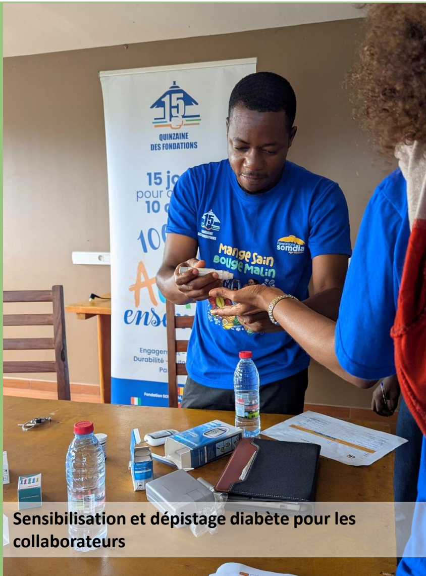
Sensibilisation et dépistage diabète pour les collaborateurs