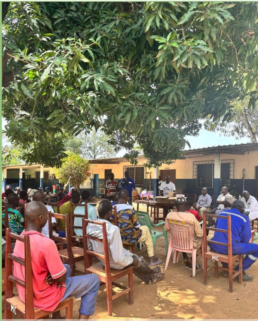
Sensibilisation sur le diabète