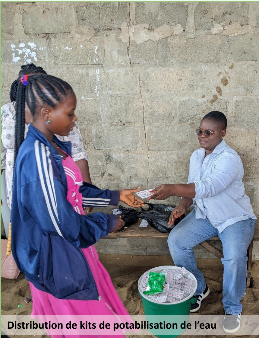
Distribution de kits de potabilisation de l'eau

600 Kits de potabilisation distribués (pastilles)